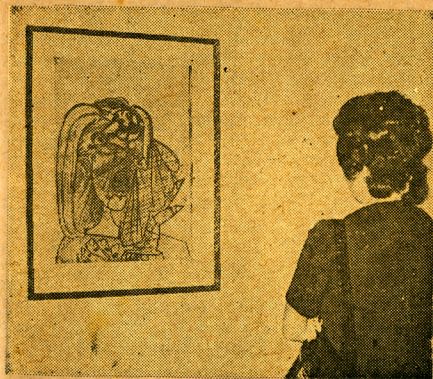
"Cabeza de mujer", de Picasso, una de las más valiosas piezas de la muestra surrealista

Entretanto, las galerías estuvieron abocadas en una labor incansable para poder presentar todas las facetas de la actividad plástica del momento, como consta por la enorme cantidad de muestras que tuvieron lugar, y la variedad del planteamiento en las mismas. Esto, no obstante el retraimiento del apoyo