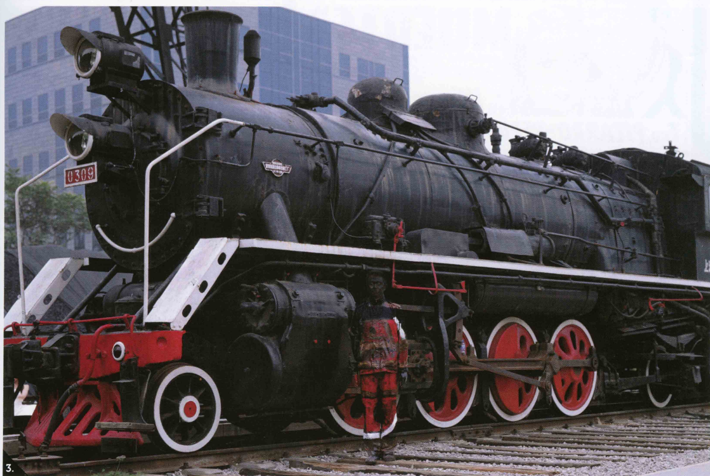
1. Hope, de Robert Indiana, artista de Galería Impakto. 2. Liu Bolin, artista de Galería Impakto.