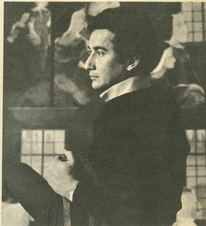
¿QUE nos quiere decir Braun?